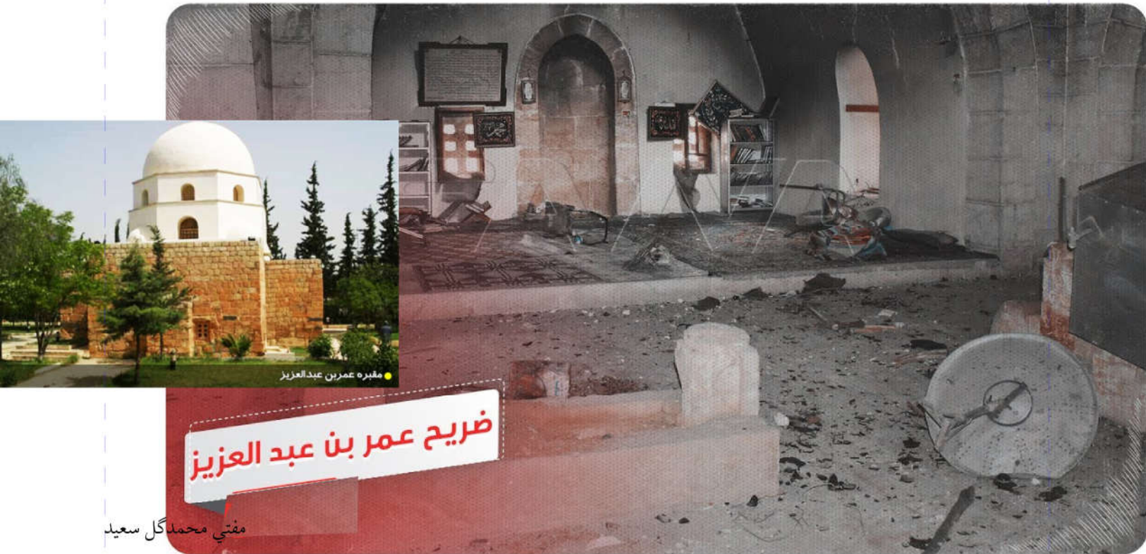
مقبره عمر بن عبدالعزیز